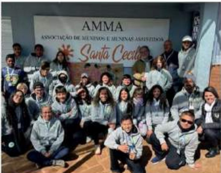
WimBelemDon é a instituição visitante

O projeto Lapidando Cidadãos realizou desde de ontem o 1º Intercâmbio de Projetos Sociais. O convidado é o projeto WimBelemDon, de Porto Alegre. O nome WimBelemDon é uma brincadeira com o tradicional torneio de Wimbledon, que acontece na Inglaterra. O tema é o caráter do projeto e o modo de ajudar crianças para que possam desfrutar da sua verdadeira finalidade: a inclusão social. Assim como o Lapidando, o objetivo final da instituição não é formar um grande torneio, mas, sim, um grande cidadão. Hoje acontecem jogos em uma amizade com posição semelhante à tradicional "Copa Davis" com jogos de integração divididos por idade e equipes. No total serão 50 crianças e adolescentes de 12 a 16 anos desfrutando de momentos de socialização, brincadeiras lúdicas, pontos e claps, muito mais. O evento é aberto à comunidade e acontece hoje das 9h às 18h e amanhã às 11h, quando acontece a final de encerramento nas quadras do tênis Santa Tereza.